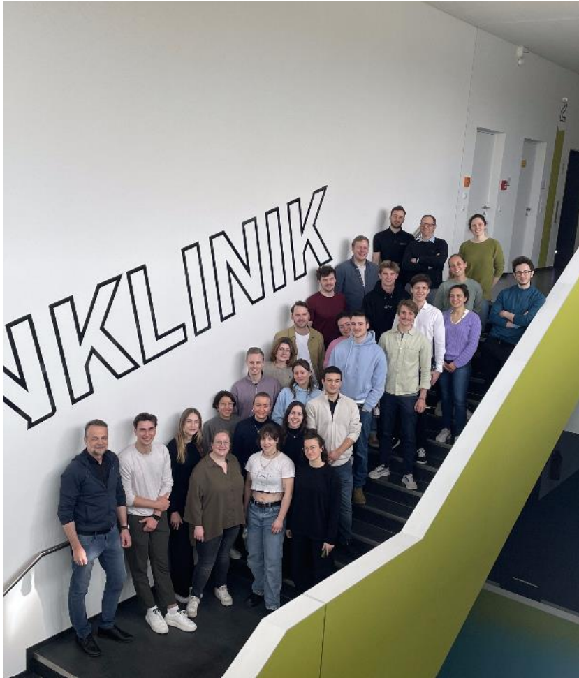
Gruppenbild in der Lernklinik des Universitätsklinikums Leipzig