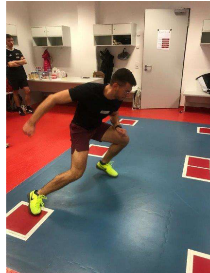
Umwendezeit auf dem Speedcourt

Diese Veranstaltung markiert den gelungenen Start ins neue Jahr für die AGA-Students und macht Lust auf die vielen weiteren Kurse, die im nächsten Semester stattfinden werden.