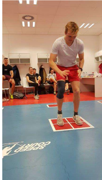
Tapping auf dem Speedcourt