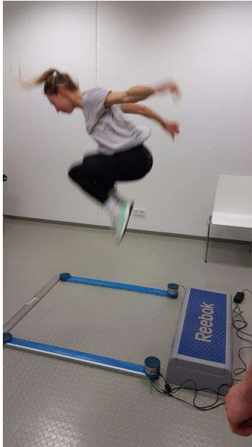
Messung der Sprungkraft und höchstem Sprung

Daraufhin durften die Student/innen selbst ihre Sportschuhe schnüren. Neben dem Speedcourt u.a. mit Tapping , Umwendezeit sowie höchstem Sprung, konnten sie sich in Sprungkraft und Höhe messen. Am Ende wurde der jeweilige Sieger der Herren und Damen geehrt.